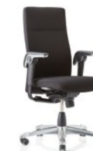
HÅG Tribute 9021