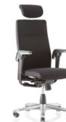
HÅG Tribute 9031